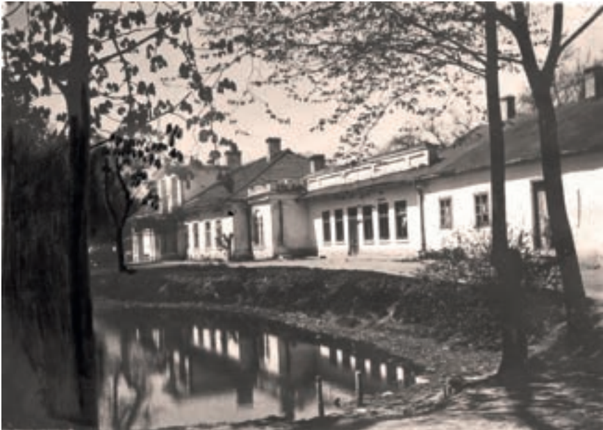
11. Klasztor urszulanek w Sierczy koło Wieliczki (1929), gdzie przebywała bł. Klemensa