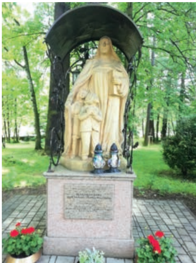
17. Figura bł. Klemensy Staszewskiej OSU w ogrodzie dawnego klasztoru urszulanek w Rokicinach Podhalańskich