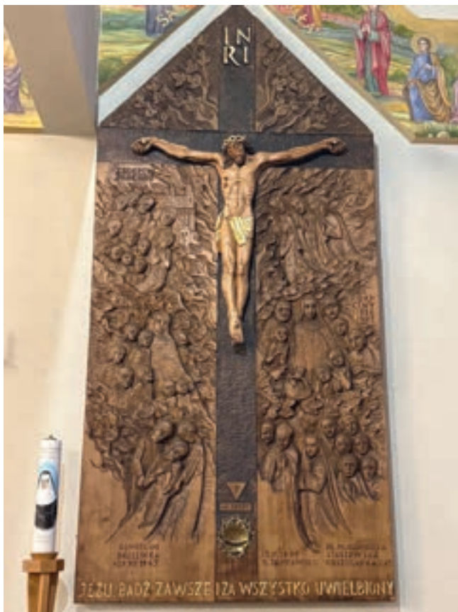
16. Ołtarz poświęcony bł. Klemensie w kościele parafialnym pod wezwaniem Miłosierdzia Bożego w Rokicinach Podhalańskich