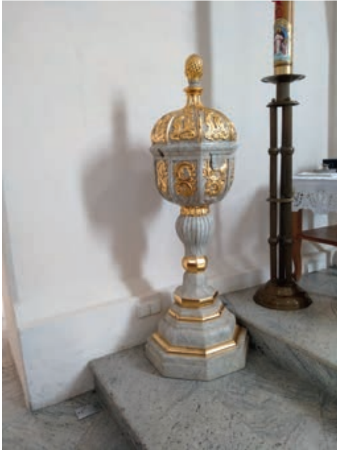
3. Zabytkowa chrzcielnica w kościele parafialnym pod wezwaniem św. Andrzeja Apostoła w Złoczewie