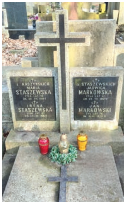
7. Grobowiec śp. Marii Staszewskiej z Kaszyńskich – matki bł. Klemensy oraz jej siostr śp. Ireny Staszewskiej i śp. Jadwigi Markowskiej z mężem. Cmentarz Stare Powązki, rząd 4, grób 6, kwatera 322