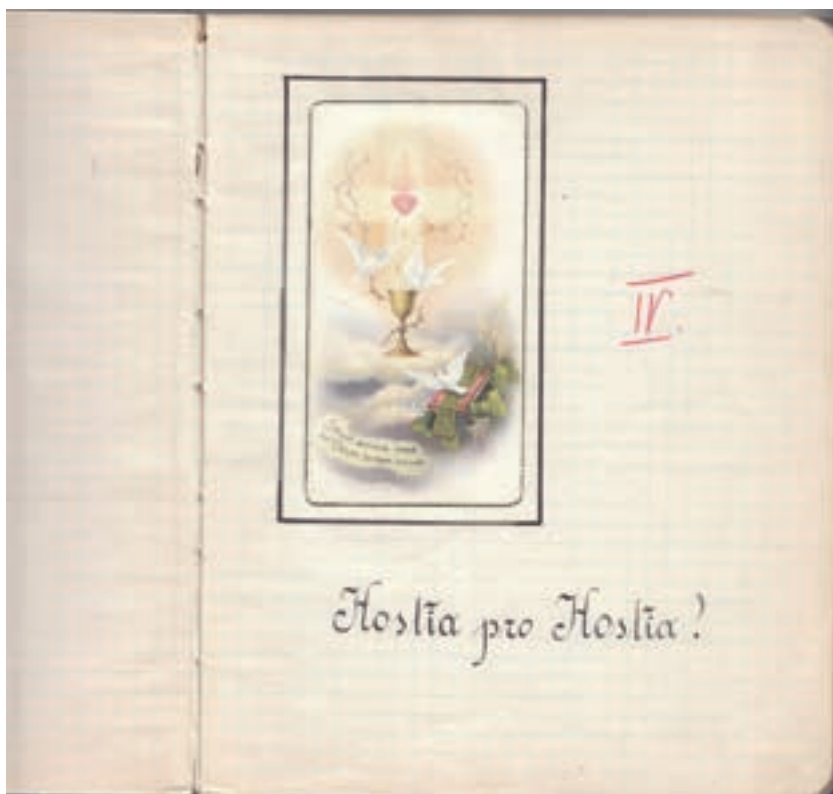
13a. Wybrane strony z notatek duchowych bł. Klemensy wraz z dopiskami Kierownika – Sługi Bożego Józefa Andrasza SJ