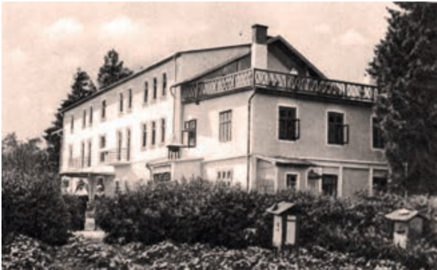
12. Klasztor urszulanek w Rokicinach Podhalańskich, w którym przebywała bł. Klemensa do czasu aresztowania przez gestapo 26 stycznia 1943