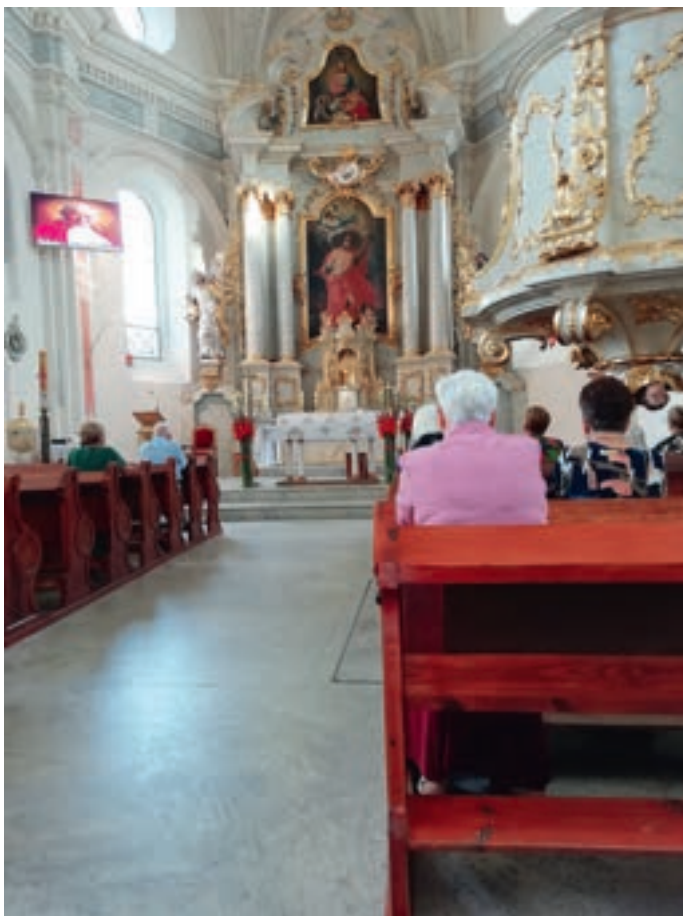
2. Współczesne wnętrze kościoła parafialnego pod wezwaniem św. Andrzeja Apostoła w Złoczewie