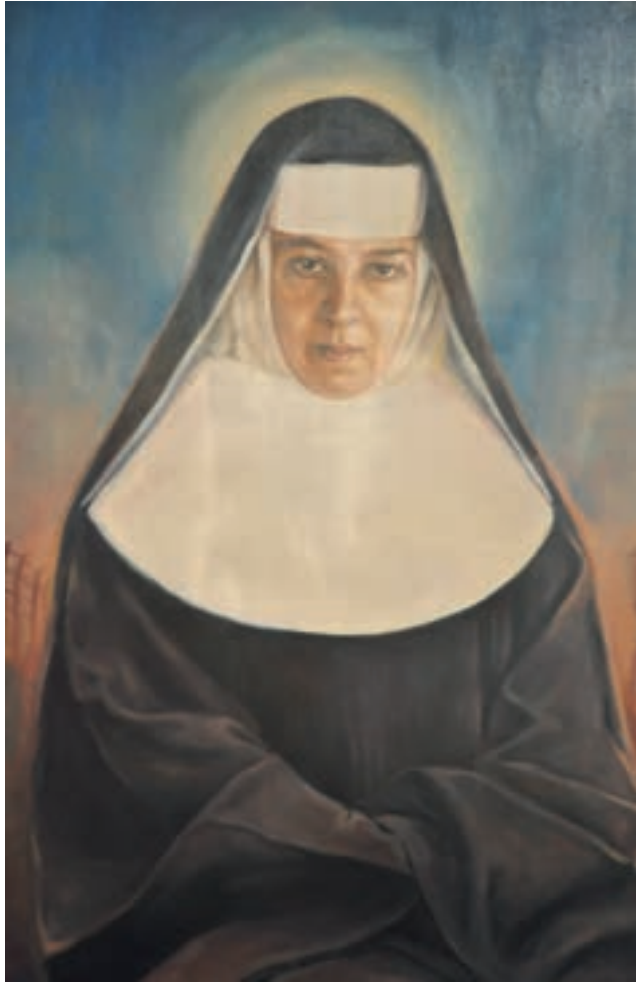
14. Portret bł. Klemensy Staszewskiej z kaplicy dawnego klasztoru urszulanek (obecnie Pałac Seniora) w Rokicinach Podhalańskich