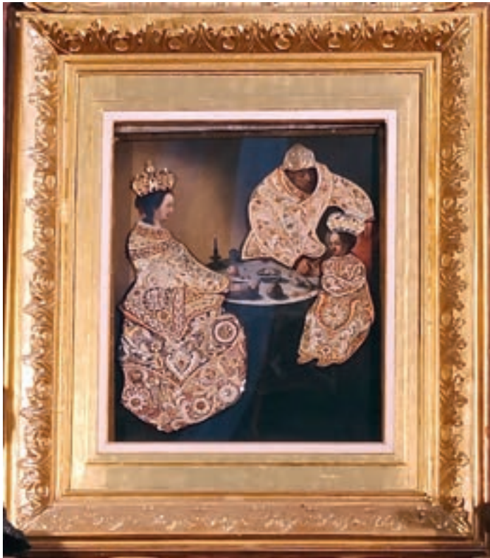
5. Obraz Matki Bożej Świętorodzinnej w Sanktuarium ze Studziannej