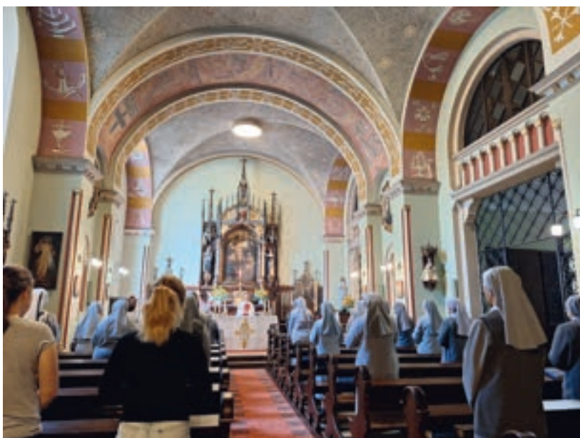
10. Współczesny wygląd kaplicy Klasztoru Sióstr Urszulanek w Krakowie, gdzie bł. Klemensa składała śluby zakonne