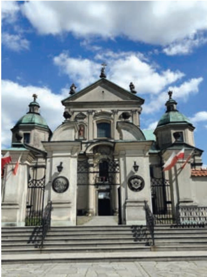
6. Bazylika Matki Bożej Świętorodzinnej w Studziannej